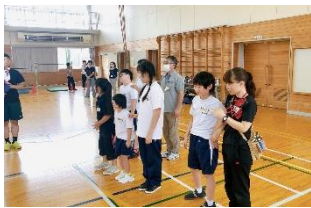
四校園スポーツ交流会